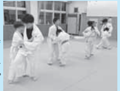
練習の様子 (稚内柔道スポーツ少年団)