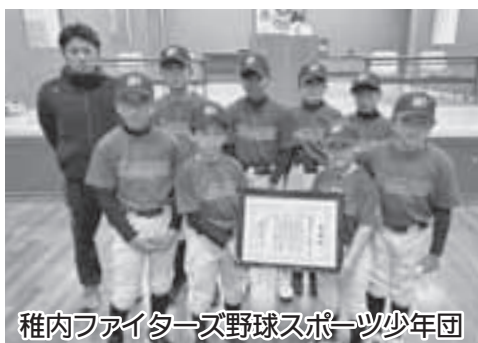
稚内ファイターズ野球スポーツ少年団