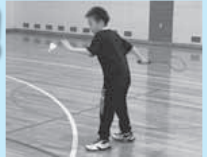
練習の様子 (稚内ノースキッドバドミントンスポーツ少年団)

スポーツ少年団に入りたい！スポーツ少年団活動に興味がある！一度見学してみたい！どのような内容でも構いませんので稚内市スポーツ少年団事務局（☎28-1111）までお気軽にお問合せください。